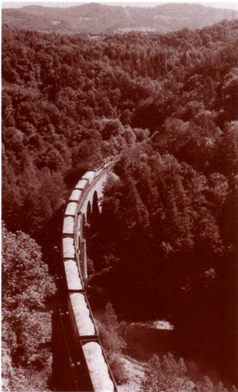
Un train de marchandises, transportant du bois sur le viaduc de Fontannes, peu après Monistrol d'Allier

Quelques anecdotes croustillantes existent également à propos de l'impossibilité d'acheter des billets pour ce train, notamment en gare d'Arvant! Il y a plus d'un an, la SNCF avait décidé de "shunter" cette bourgade, n'autorisant plus la montée des voyageurs alors qu'un arrêt "technique" y était maintenu aux mêmes horaires! Pendant quelque temps les voyageurs d'Arvant se munirent de billets "Brioude - Paris" et allaient "chercher" le train en amont, à grand renfort d'automobiles et pour un coût supérieur! 9 minutes plus tard, ils avaient le plaisir de s'arrêter à nouveau dans leur gare! Qu'à cela ne tienne, la centrale de réservation de la SNCF a brusquement bloqué le terminal informatique d'Arvant, empêchant ainsi la délivrance de billets pour le train de nuit! Face à une telle ineptie, il a fallu faire intervenir les élus locaux pour rétablir la situation antérieure et ainsi la desserte de cette commune!