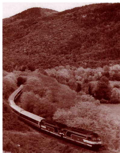
Le "Cévenol" près de Langeac s'apprête à remonter les splendides Gorges de l'Allier

La fréquentation de ce train étant sans doute encore trop élevée pour être discutable à la lecture des sta-